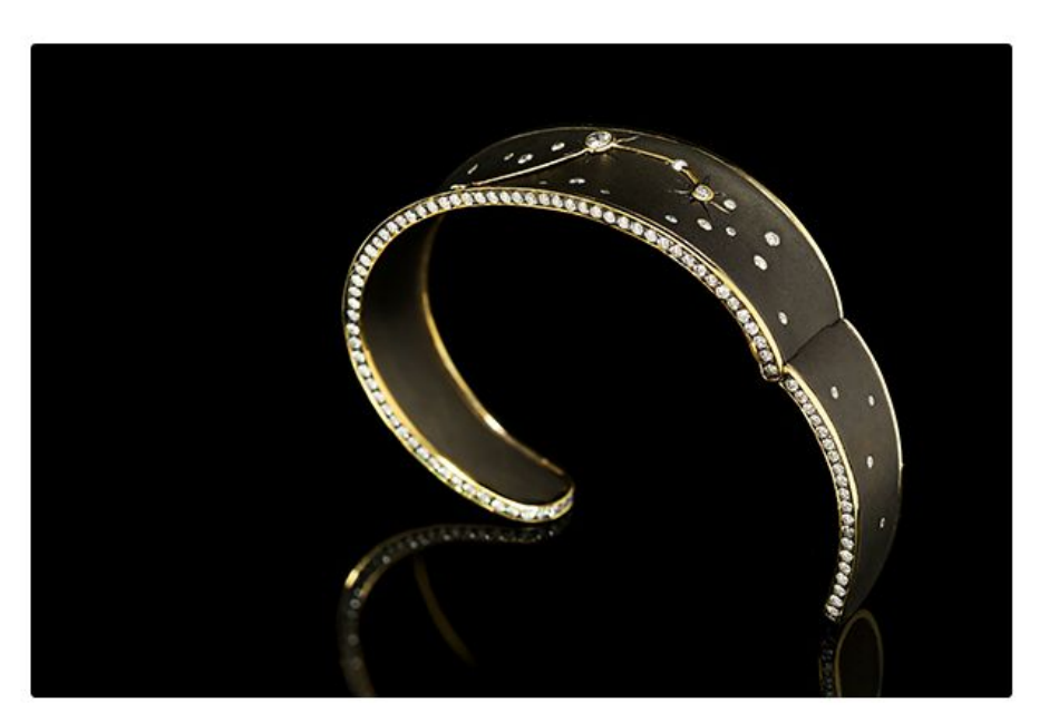
القلة القليلة من صناع المجوهرات في العالم يملكون المهارات اللازمة لتنفيذ هكذا تقنيات لانتاج قطع فريدة من نوعها تتعالى على الوصف.