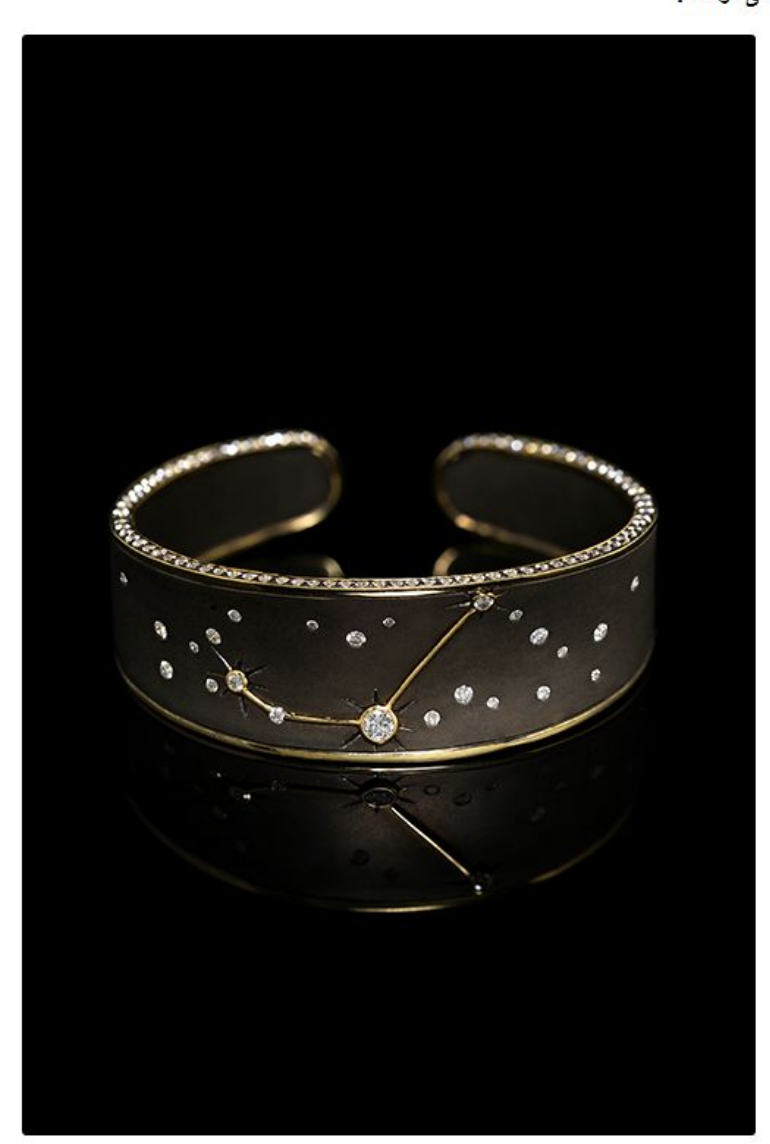
يمكن زيارة متجر 'بايال نيويورك' بناءً على موعدٍ مسبق فقط، حيث يمكن للعملاء انتقاء قطعهم المفضلة من المجموعات المعنونة بطابع معين أو طلب الحصول على قطعة مفصلة تبعاً للطلب تعبّر عن شخصيتهم في تصميمٍ متفرد واستثنائي.