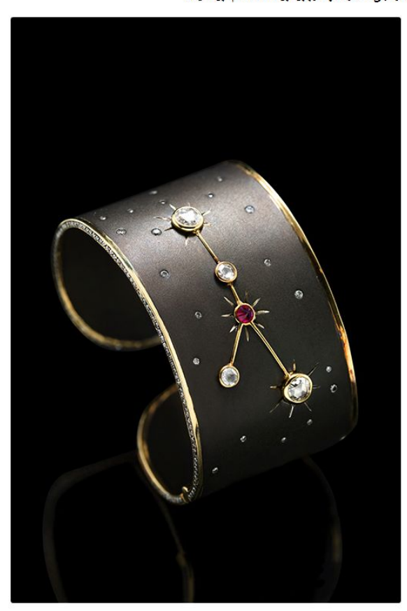
يتمحور العيد عن اجتماع الأحبة، وهو مناسبة مثالية لتقديم هدايا متميزة وخاصة لهم. تحكي كل قطعة مجوهرات من مجموعة 'كوكبة' قصةً ساحرة لكل شهرٍ ما يجطها فريدة وخاصة لكل فرد.

يتضمن كل سوارٍ. جوهرة المولد الخاصة بالشهر المعني بما تعمله من معانٍ. كما استخدمت العلامة أحجاراً كريمة نادرة وخلاية كالياقوت، والزمرد والماس مع تفاصيل روحاتية لتتألق مجموعة "كوكية" بتصاميمها الرائعة التي تأخذنا في رحلة ساحرة إلى حضارة الهند وبايل قبل 3 آلاف عام قبل الميلاد.