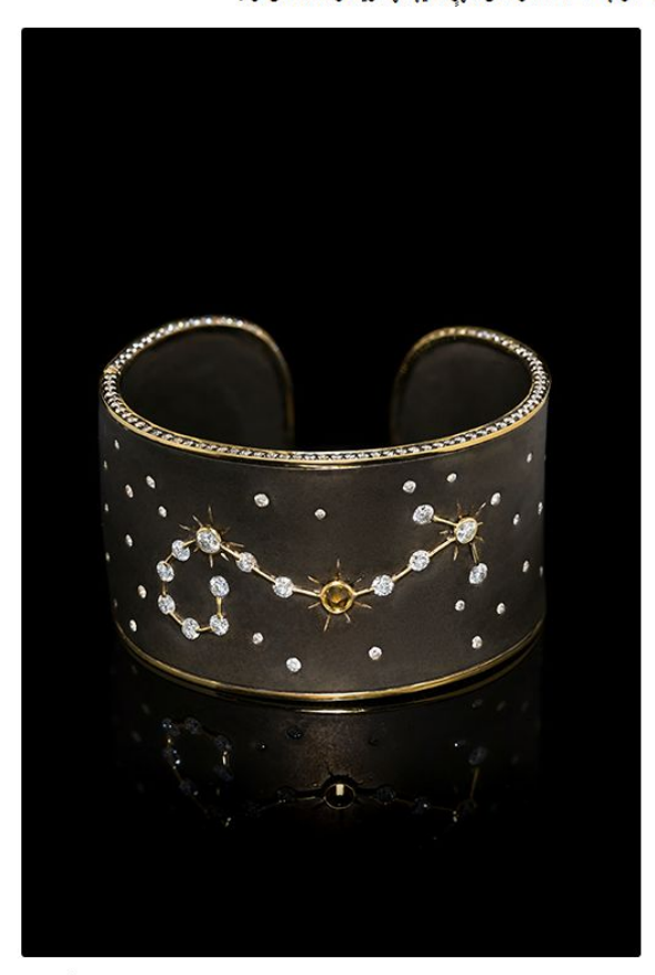
تم تصميم كل قطعة بعناية كبيرة باستخدام مزيج من الذهب والفضة، مما يجعل الأمر أكثر صعوبة نظراً لعدم تمارّج المعنين سويةً. كما استخدمت "بايال نيويورك" الفضة المؤكسدة لتبتكر اللون الرمادي الذي يبرز الماس في السوار ببريق النجوم في الأمسيات الصافية.